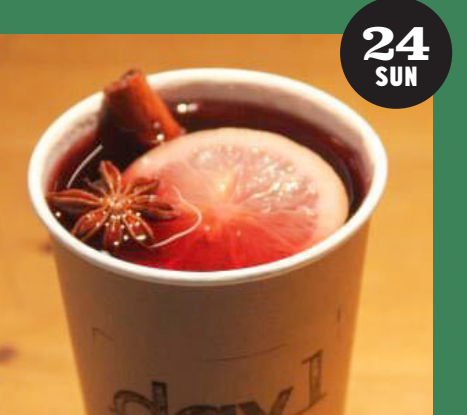
day1 (コーヒール、ホットドッグなど)