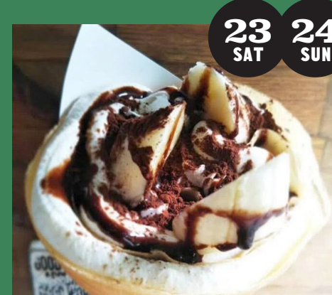
cafe wagon 笑来途 (クレープ、ホットワイン)