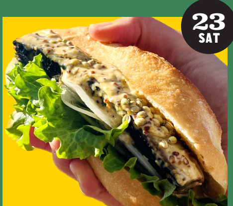
u3doco (サブサンド、クラフトビールなど)