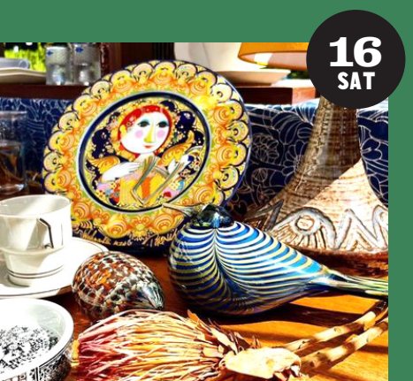
暮らし i.ro.do.ru. 北欧ヴィンテージ (北欧ヴィンテージ食器、雑貨など)