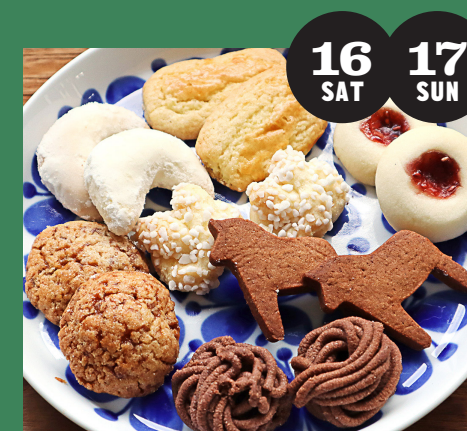
スウェーデン菓子 リッカ・カッテン (焼き菓子)