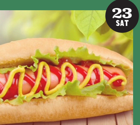
Shungorou Sausage (ソーセージ、ホットドッグなど)