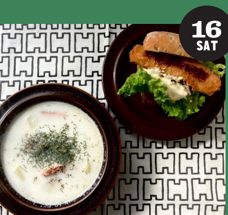
北欧酒場 Shima-Tori (サーモンスープ、ソーセージ、ホットワインなど)