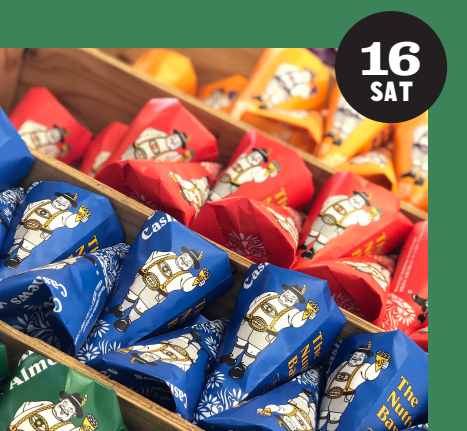
ナッティー・ババリアン (キャラメルナッツ)